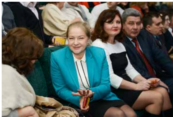
С коллегами на отчетной конференции Адвокатской палаты Ростовской области.

так и для тех, у кого уже есть собственный опыт обращения в ЕСПЧ. Вопросы применения Европейской Конвенции, являющиеся очень актуальными для наших адвокатов, освещались специалистами высочайшего уровня. Все встречи, дискуссии, лекции носили предметный и практический характер и проходили в режиме оживленного диалога. Мы убедились, что имеющаяся возможность тщательной подготовки и обоснованного направления приемлемых жалоб в ЕСПЧ имеет значение не только для разрешения проблемы одного заявителя, но и для улучшения в целом ситуации с соблюдением прав человека и основных свобод в России.