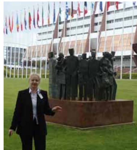
В Европейском Суде по правам человека.