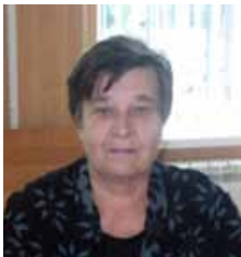
Блиц-интервью журналу «Южнороссийский адвокат»

– Были в вашей адвокатской практике случаи, когда вам пришлось всё отложить и заниматься проблемами доверителя?