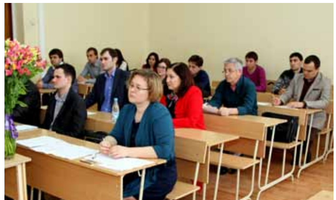
Первый набор слушателей.