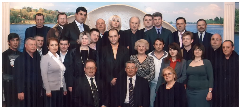
С коллективом Филиала по таможенным и транспортным делам Ростовской областной коллегии адвокатов.