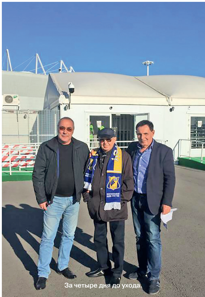
За четыре дня до ухода.