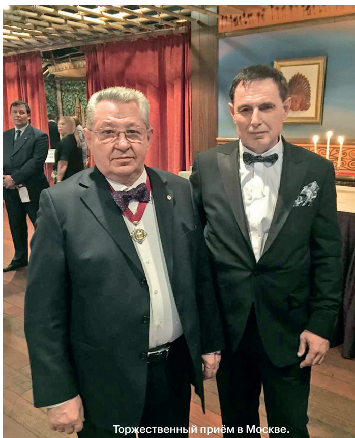
Торжественный приём в Москве.

Этот человек умел с каждым из нас найти ту волну общения, которая создавала настоящий, естественный комфорт для собеседника. И он пронёс это качество через всю свою жизнь.