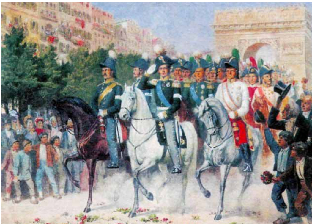
Вступление русских войск в Париж в 1814 г. Худ. А. Кившенко.

му корпусу путь к отступлению. Сразу же после получения этой информации Платов снялся с места и ускоренным маршем двинулся через Бервер и Куртнеэ к Вильдеву-ля-Ру. Лишь только донцы достигли этого селения и начали здесь переправу по мосту, как на Санской дороге показались французы. Это, как выяснилось вскоре, был авангард генерала Жерара. Около 4-х тысяч французов начали массированную атаку на переправляющихся казаков, нанеся им немалый урон. Платову удалось на время остановить врага, но когда противник получил подкрепление, атаман отдал приказ отступить к Жуаньи. Соединившись здесь с отрядом генерал-майора Сеславина, он вступил в город Арси-Сюр-Об.