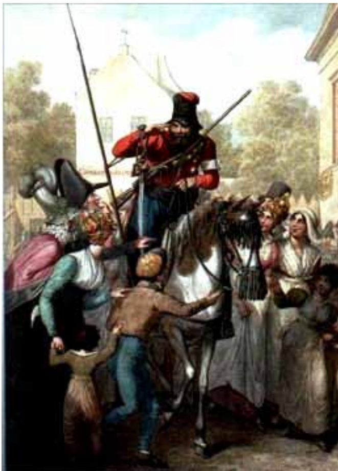
Казачи в Париже. Акварель Георга-Эммануэля Опица.

При Намюре нежданно-негаданно скрестились на короткое время жизненные пути Платова и знаменитого польского генерала Костюшко. Этот опальный генерал жил в это время недалеко от Намюра, выехал из России после объявления ему амнистии Павлом I. С приходом в эти края русских войск Костюшко обратился к начальнику одного из русских отрядов с письмом, в котором говорилось: «Я поляк, зовут меня Костюшко; некогда имел честь предводительствовать войсками моего отечества. После я удалился от света в деревню Бервиль, принадлежащую моему другу Цельтнеру, бывшему в Париже швейцарским посланником. Мы живем вместе почти пятнадцать лет, никем не знаемые. Сделайте милость, поместите в небольшое наше имение несколько человек русских для охранения от беглых или отставших от армии солдат».