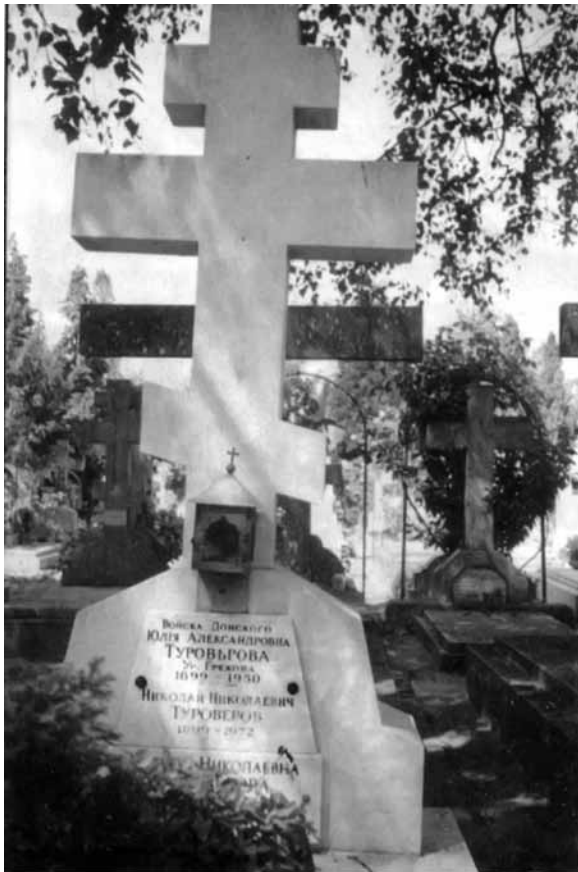
Памятник на могиле Н.Н. и Ю.А. Туроверовых на кладбище Сент-Женевьев де Буа