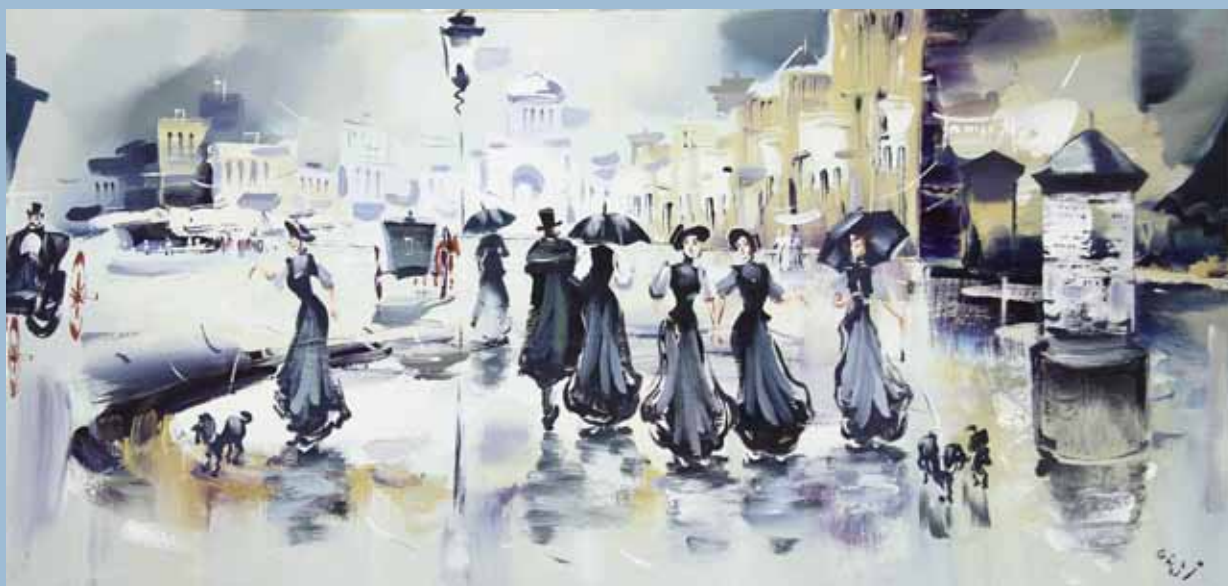
Гаси. Старый город.