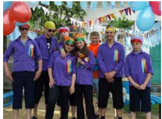
Летние каникулы в спецшколе.